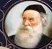
קדילת ארז השלחם חבד ליבאולטו