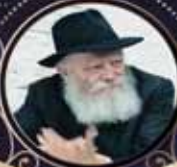
בתחמם מארנה רשעה מסקנה רסיה

РАСПРЕДЕЛЕНИЕ ТРАКТАТОВ МИШНЫ И ГЕМАРЫ לכבוד י"ט כסלו - חג הטאולה של חוד כ"ק האדמורר חסו"ק בעל התניא והשו"ע רבי