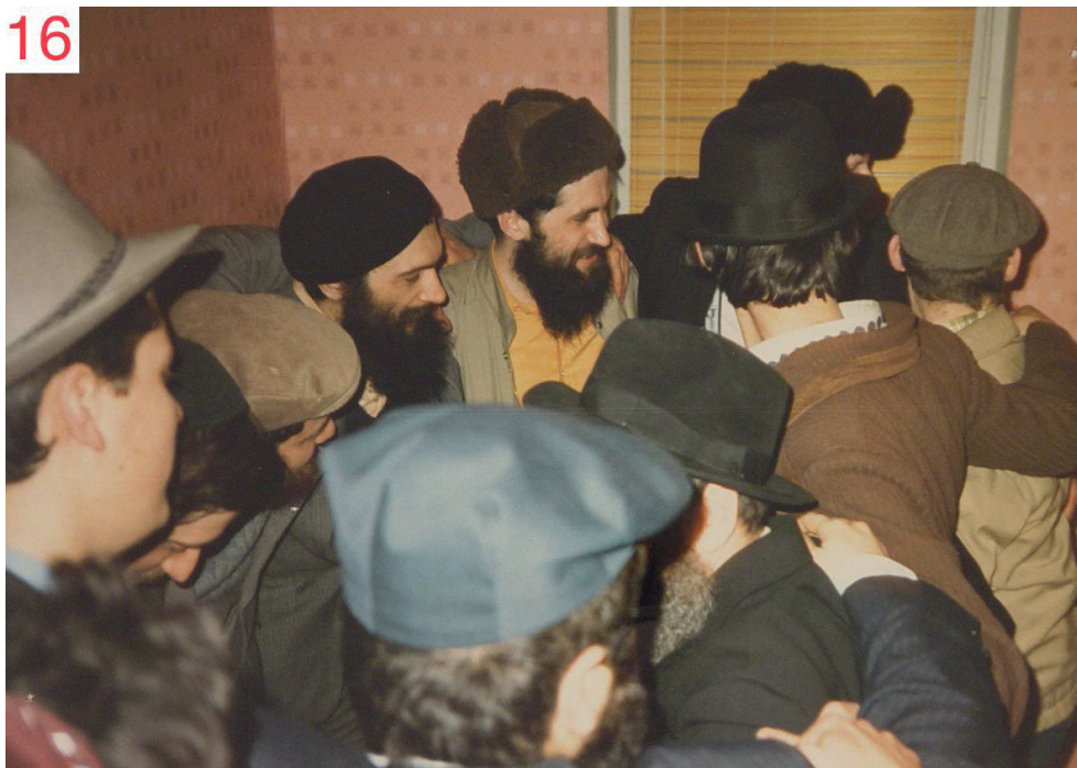
ריקוד חסידי בדירה קטנה במוסקווא.