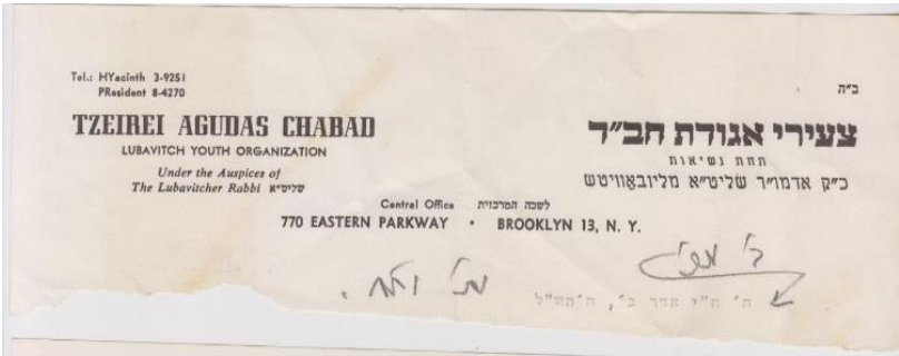
לקמון מענה נא